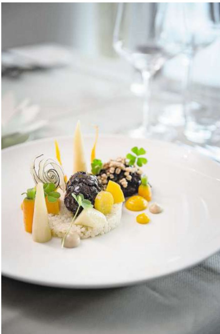
Der Guide Bleu widmet sich der hohen Kochkunst. Im Bild eine Kreation aus dem «Belvédère in Hergiswil. Bild: Manuela Jans (18. November 2016)

Wenn es sein muss, werden die Tester auch konkret. So heisst es über die Villa Honegg in En-